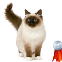
Sacré de Birmanie